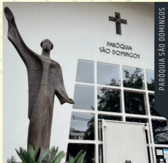
PARÓQUIA SÃO DOMINGOS