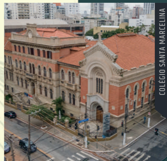
COLÉGIO SANTA MARCELINA