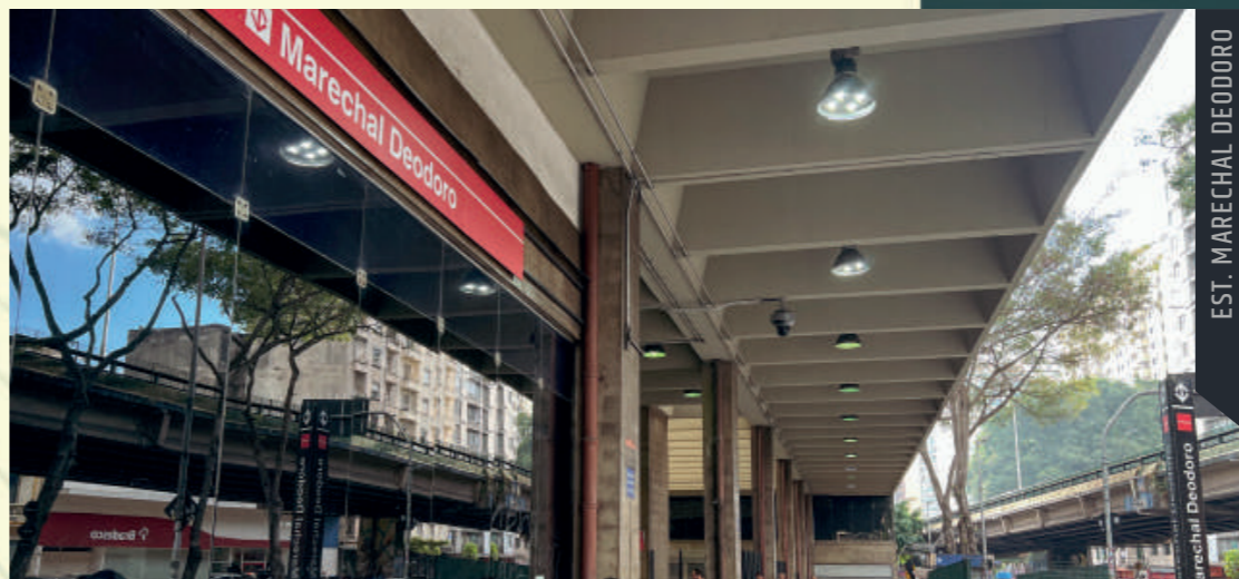
EST. MARECHAL DEODORO