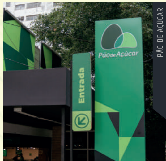
PÃO DE AÇÚCAR