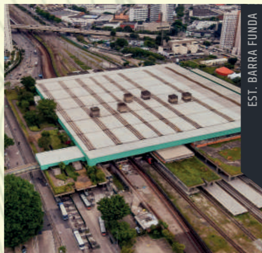
EST. BARRA FUNDA